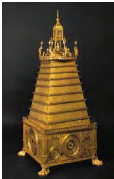
Christoph Rohr (1582–1601) Kugellaufuhr, 1600 Bronze, vergoldet