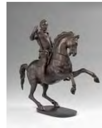
Adriaen de Vries (1560–1626) Herzog Heinrich Julius zu Pferde um 1605, Bronze