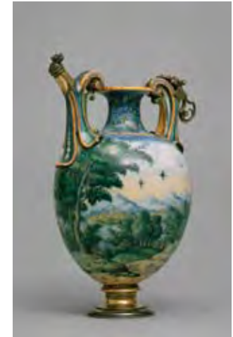
Medici-Porzellan Italien, um 1580 Frittenporzellan